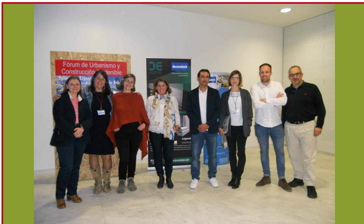
Imagen de la pasada edición del Fórum celebrado en Oviedo

La eficiencia energética en edificios sostenibles y el renacimiento de la madera en la construcción serán algunos de los temas que formarán parte del programa de conferencias y mesas de análisis y opinión.