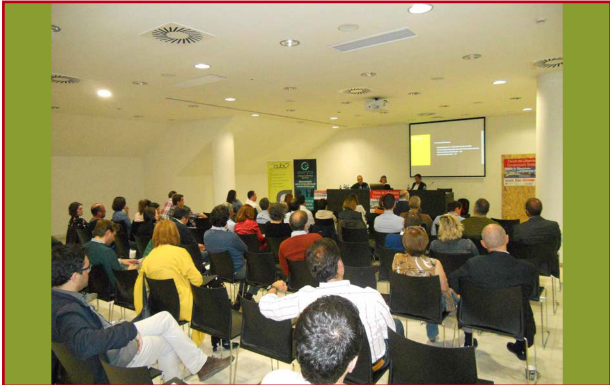
Imagen de la pasada edición del Fórum celebrado en Oviedo