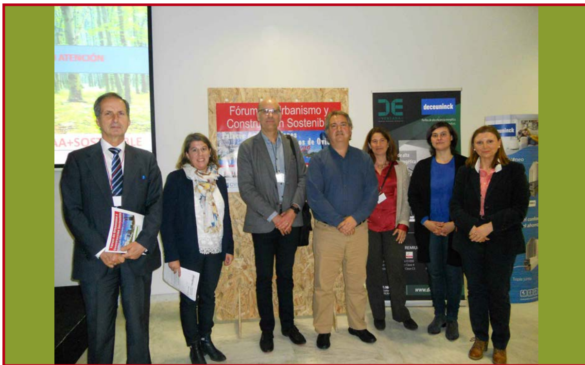
Imagen de la pasada edición del Fórum celebrado en Oviedo