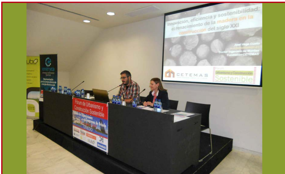
Imagen de la pasada edición del Fórum celebrado en Oviedo

defectos o patologías en los edificios que propician la formación de mohos, alcanzar excelentes niveles de confort térmico y una altísima calidad del aire interior, o asegurar la disminución de la huella de carbono y otros daños ambientales derivados del derroche de energía.