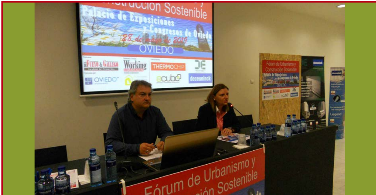
Imagen de la pasada edición del Fórum celebrado en Oviedo

extendido y contrastado a nivel mundial es el estándar Passivhaus , cuyo primer edificio se construyó en Darmstadt (Alemania) en 1990 y que cuenta con una amplia trayectoria de edificios construidos en todo el mundo.