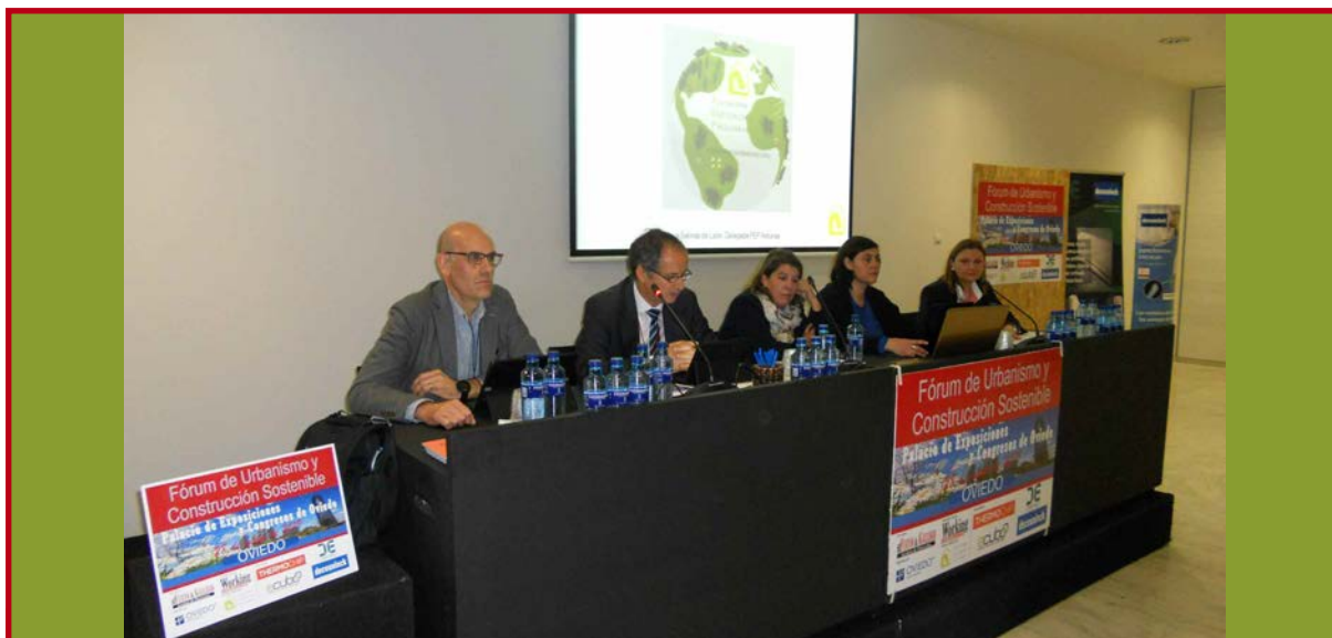
Imagen de la pasada edición del Fórum celebrado en Oviedo